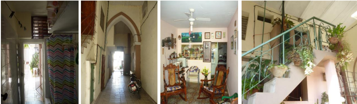
Figura 15, 16, 17 y 18: Transformaciones en el interior que afectan el confort ambiental de la vivienda.

las afectaciones, del trabajo de organismos e instituciones y de una amplia participación de sus habitantes, pues sin ellos no se alcanzaría la conservación de importantes exponentes del patrimonio habitacional.