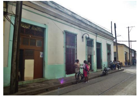
Figura 12: Transformaciones en la vivienda ubicada en Independencia 152. Fuente: Elaboración propia.

Pero las transformaciones más significativas aparecen hacia el interior de la misma, consecuencia de la subdivisión de los lotes originales. Las imágenes de lo que aún se conserva de su patio interior dan muestra de ello. Elementos totalmente contemporáneos ponen de manifiesto la irreversibilidad de las transformaciones sufridas por la vivienda y las serias afectaciones al patrimonio.