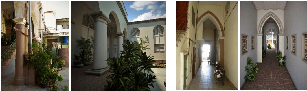
Figuras 23, 24, 25 y 26: Interiores proyectados a partir de las recomendaciones de diseño propuestas.