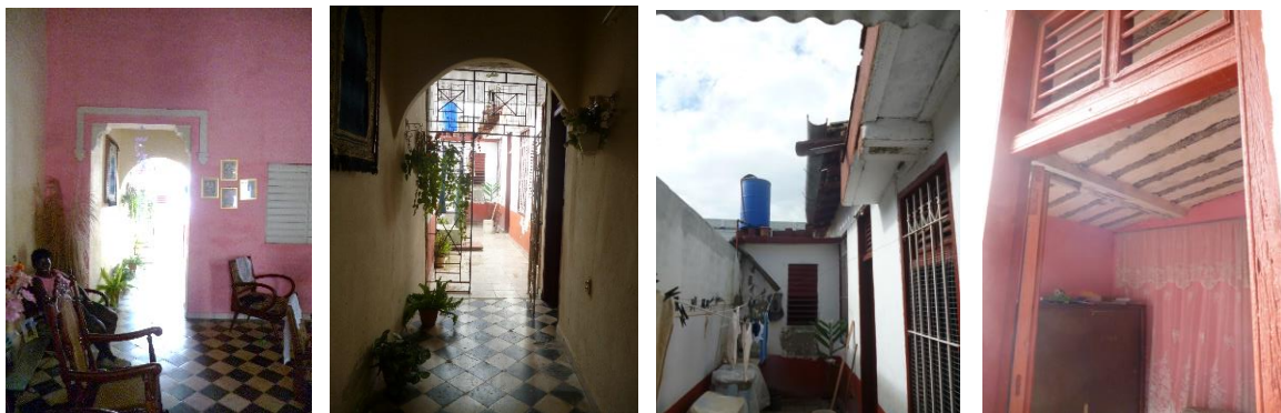
Figura 8, 9, 10 y 11: Transformaciones en el interior que afectan el confort ambiental de la vivienda.

afectaciones al confort ambiental que en su momento tuvo la vivienda original. Subdivisiones del lote modificaron las condiciones de ventilación e iluminación natural y la relación interior-exterior. En la actualidad se pierde el patio original disminuyendo su área.