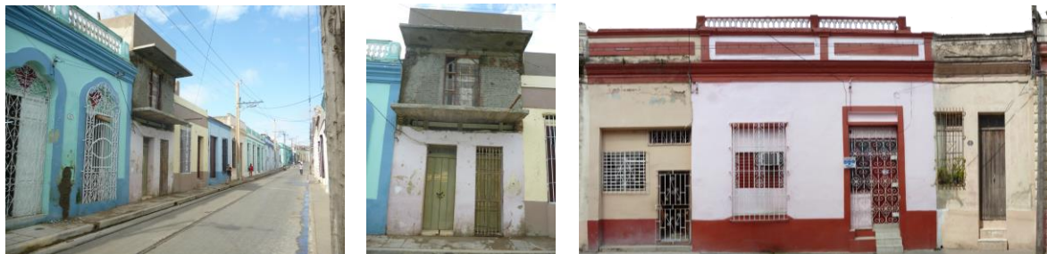
Figuras 3, 4 y 5: Serias transformaciones que evidencian la imagen descualificada del eje Independencia.

Las transformaciones apreciables hoy en el eje en la mayoría de los casos son resultado del crecimiento o la segregación del núcleo familiar unido al déficit de estacionamientos en el centro histórico de la ciudad. Se evidencia falta de control por parte de las autoridades para detener a tiempo las malas prácticas que afectan la integridad y conservación de los bienes patrimoniales. Aun cuando se conocen las regulaciones impera la necesidad de resolver problemas objetivos sin importar las consecuencias de las transformaciones realizadas, así aparecen nuevas construcciones y elementos constructivos (carpintería y herrería) carentes de criterios de diseño que no se integran al perfil y como resultado de ello la imagen urbana descualificada.