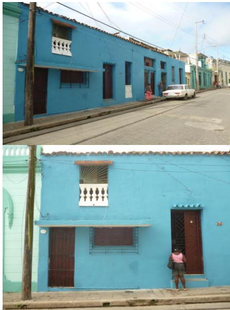
Figuras 6 y 7: Transformaciones en la vivienda ubicada en Independencia 105-109.

Las intervenciones realizadas en la vivienda original, apreciables hoy en la imagen urbana del eje, repercutieron en el interior de la misma por lo que se pierden elementos originales que le aportaron esplendor en el siglo XIX y primeras décadas del XX, entre estos el techo de par e hileras y cuadrales de madera de cedro, con lacería central y elementos figurativos, las columnas cilíndricas de capiteles toscanos con detalles de cadenas e iniciales a sobre relieve, y sobre estos un arco polilobulado, las losas catalanas de revestimiento del muro de cocina, el aljibe hacia el patio, las losas de barro en una porción del piso y la planta en U . Esta última transformación fue decisiva en el deterioro de las condiciones ambientales hacia el interior de la misma, con las correspondientes