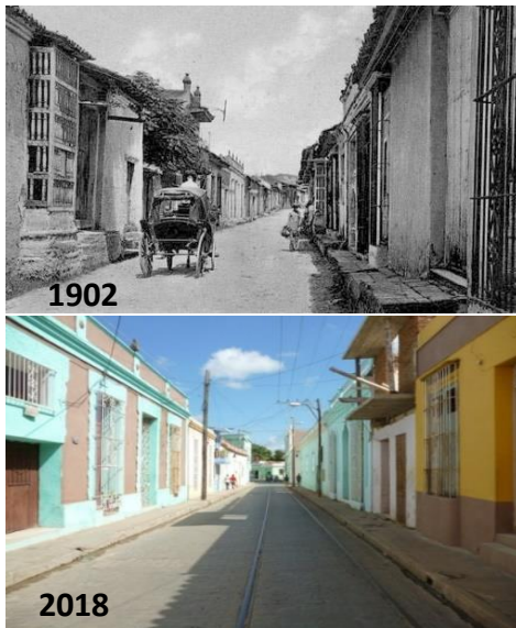
Figuras 1 y 2: Evolución Calle Independencia.

nombre actual de Independencia fue propuesto por el Ayuntamiento en sesión del 23 de enero de 1899. El mismo se extiende desde la Plazuela del Puente hasta la calle Ignacio Agramonte, antigua Soledad.