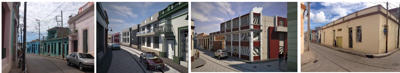
Figuras 19, 20, 21 y 22: Inmuebles proyectados a partir de las recomendaciones de diseño urbanas y arquitectónicas propuestas.

Para mitigar las transformaciones en las diferentes categorías de intervención a nivel arquitectónico y la aplicación de los criterios generales de diseño expuestos con anterioridad se recomienda: