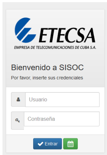
Ilustración 3 Página Autenticarse

Una vez autenticado el usuario el sistema mostrará al usuario los módulos a los que éste tiene acceso. La Especialista C en Telemática cuenta con acceso a todas las funcionalidades del sistema, excepto a la gestión de la información enviada por los Ejecutivos Comerciales. Se muestra una ilustración correspondiente a la interfaz principal del sistema (elaboración propia):