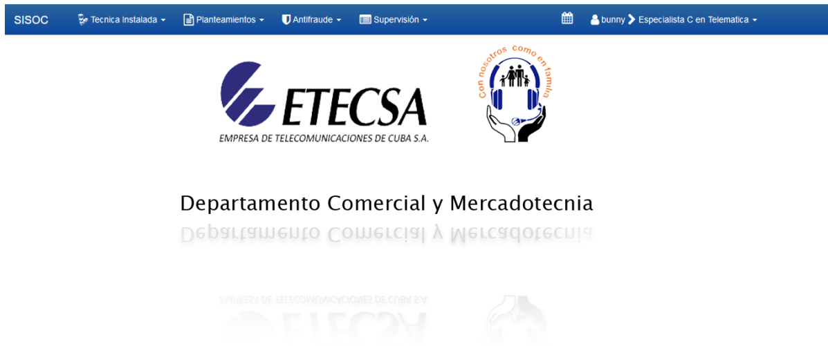
Ilustración 4 Interfaz principal del sistema

Una vez autenticado el usuario el sistema mostrará al usuario los módulos a los que éste tiene acceso. La Especialista C en Telemática cuenta con acceso a todas las funcionalidades del sistema, excepto a la gestión de la información enviada por los Ejecutivos Comerciales. Se muestra una ilustración correspondiente a la interfaz principal del sistema (elaboración propia):