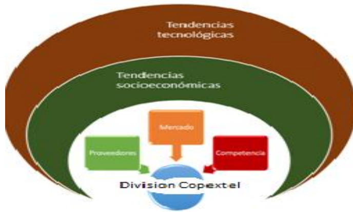
Figura 2: Diagrama-resumen del contexto a investigar. Elaboración propia

empresa se define que se necesita profundizar en aspectos del micro entorno y tendencias específicas del macro entorno tecnológico y socio-económico. Los elementos a estudiar se resumen en el siguiente diagrama (Figura 2):