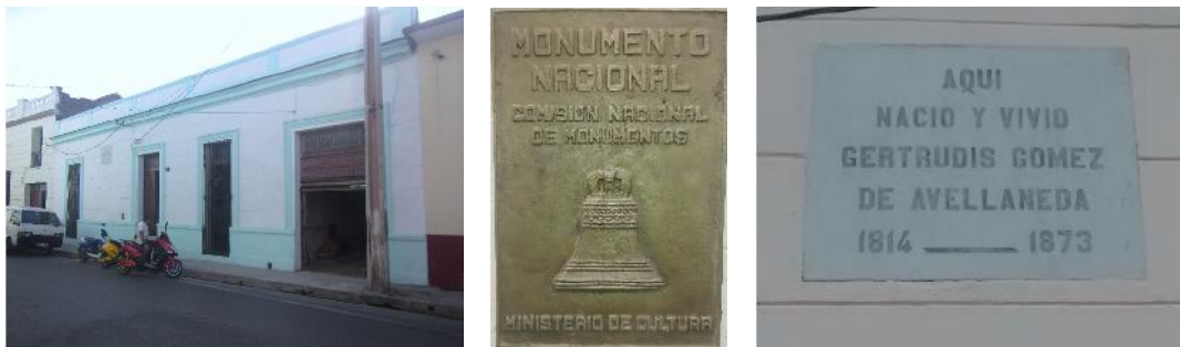
Figuras 2, 3 y 4: Foto actual del inmueble y tarjas.

Al realizar el análisis es necesario resaltar que la calle Avellaneda es uno de los más antiguos e importantes ejes urbanos de la ciudad, desde el siglo XVII.