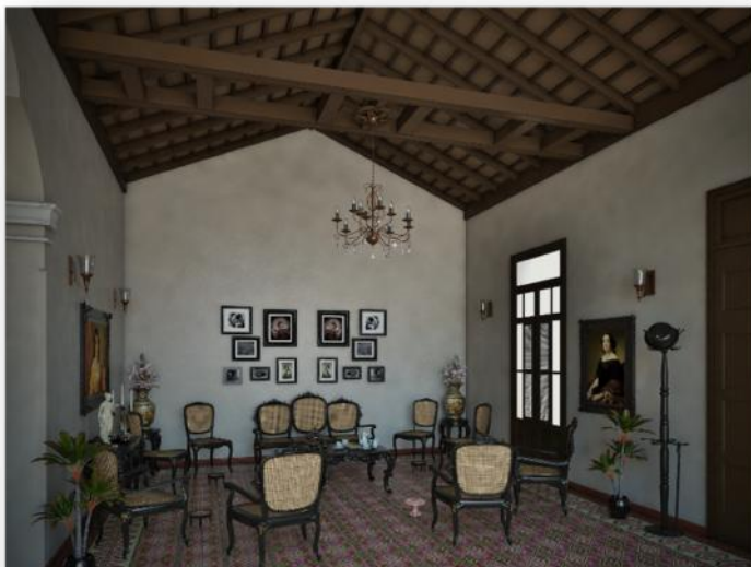
Figura 7: Propuesta de interiores después de la intervención al inmueble.

A partir de este análisis por los documentos internacionales, se puede concluir que la Restauración tiene como fin devolver la unidad de los elementos originales que conforman un bien mediante una