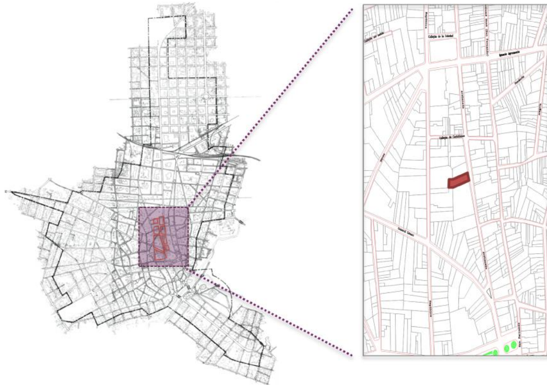
Figuras 1: Microlocalización del inmueble.

El inmueble a trabajar se encuentra ubicado en la calle Avellaneda 67 / Callejón Castellanos y General Gómez. Dicho inmueble se sitúa en una de las arterias fundamentales de la ciudad, que persiste prácticamente todo el día con un tránsito continuo. Las manzanas que forman el contexto son de tamaño medio y con una geometría trapezoidal, de hecho una de las manzanas más amplias es en la que se encuentra el inmueble a trabajar, que por una de sus aristas convergen la calle Avellaneda y la calle General Gómez, quedando interno en la forma un islote en el que se erige una escultura dedicada a la poetisa Gertrudis Gómez de Avellaneda.