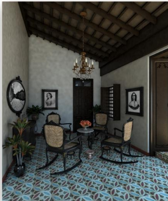
Figuras 5 y 6: Propuesta de interiores después de la intervención al inmueble.

A partir de este análisis por los documentos internacionales, se puede concluir que la Restauración tiene como fin devolver la unidad de los elementos originales que conforman un bien mediante una