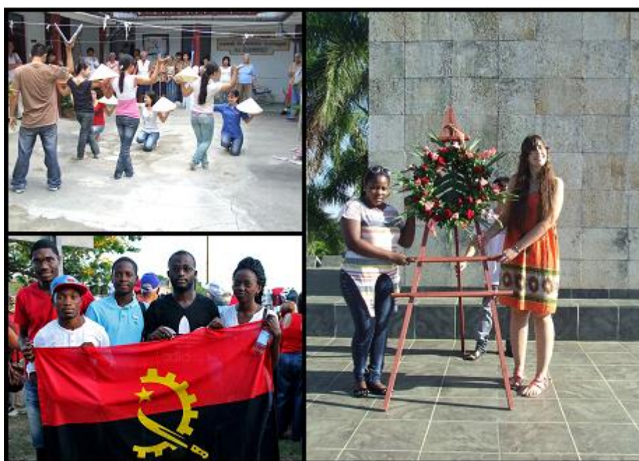
Figura 5. Estudiantes vietnamitas, angolanos y argentinos en diversas actividades extracurriculares.