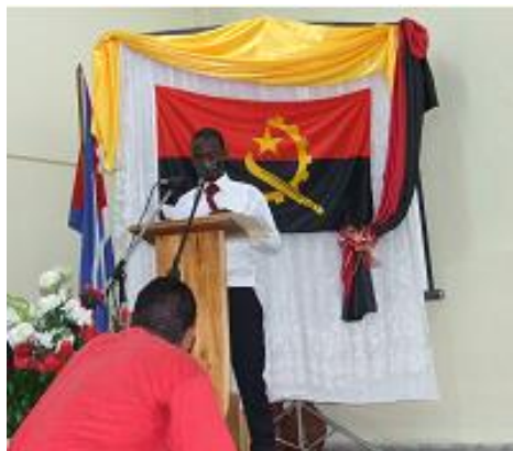
Figura 7. Actividad de intercambio entre Cuba y Angola donde el orador tanto en español como en portugués es un estudiante angolano.