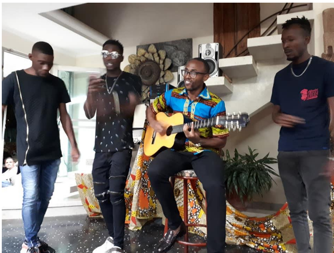
Figura 4. Representaciones de estudiantes en Festivales Culturales de Artistas Aficionados al Arte.