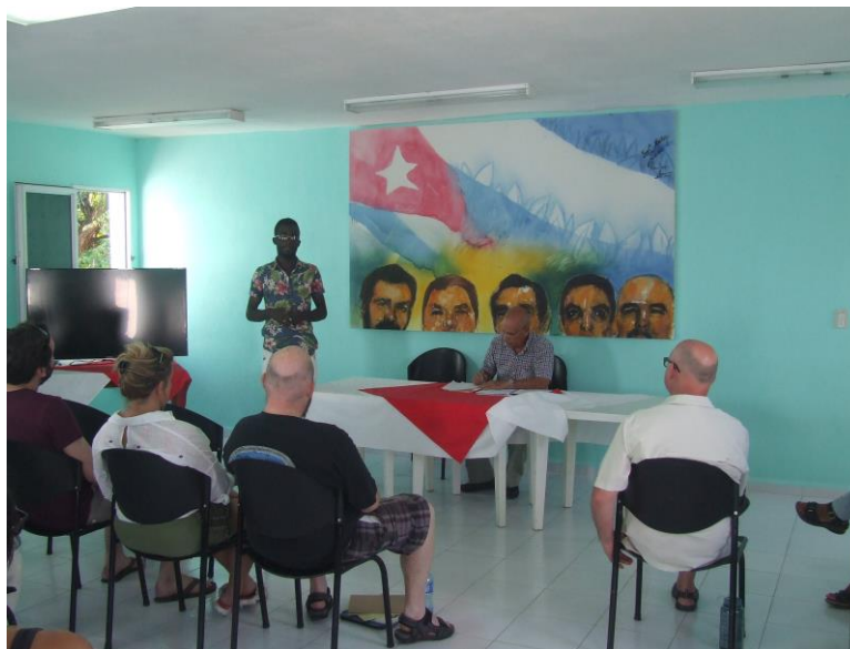
Figura 6. Exposición e intercambio de estudiante extranjero con Brigada de Solidaridad canadiense (Fuente: elaboración propia).

organizan varias actividades de este tipo a pedido de los mismos y en las cuales participan miembros de la comunidad universitaria, existiendo un debate en los dos sentidos.