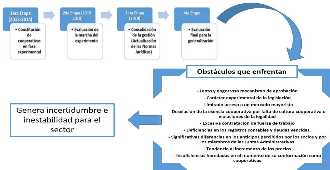
Figura 2: Etapas del proceso experimental de creación y funcionamiento de las CNA y principales obstáculos.

requeridos (Molina Camacho, 2003), a lo que debe agregarse el remozamiento de la educación cooperativa.