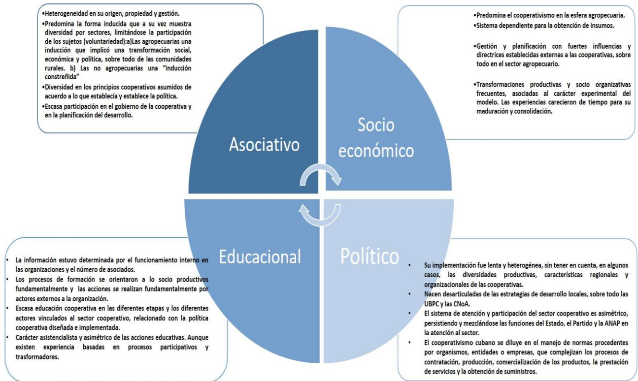
Figura 2: Tendencias del sector cooperativo desde las dimensiones asociativa, socioeconómica, educacional y política y su contribución al desarrollo socioeconómico local en Cuba (1959-2020) Fuente: Elaboración propia

socioeconómico, lo educacional y lo político en su devenir histórico y estructura del sector cooperativo; que ha lacerado su adecuada imbricación a la estrategia de desarrollo cubana (Figura 3).