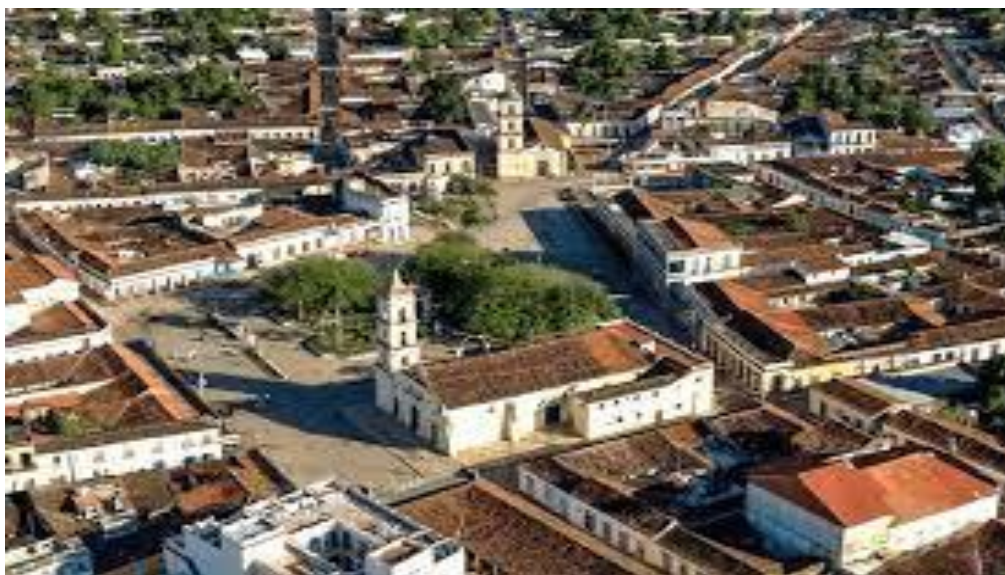
Figura 2: Ciudad San Juan de los Remedios.

Figura 1: Centro histórico urbano de Remedios, Plaza José Martí.