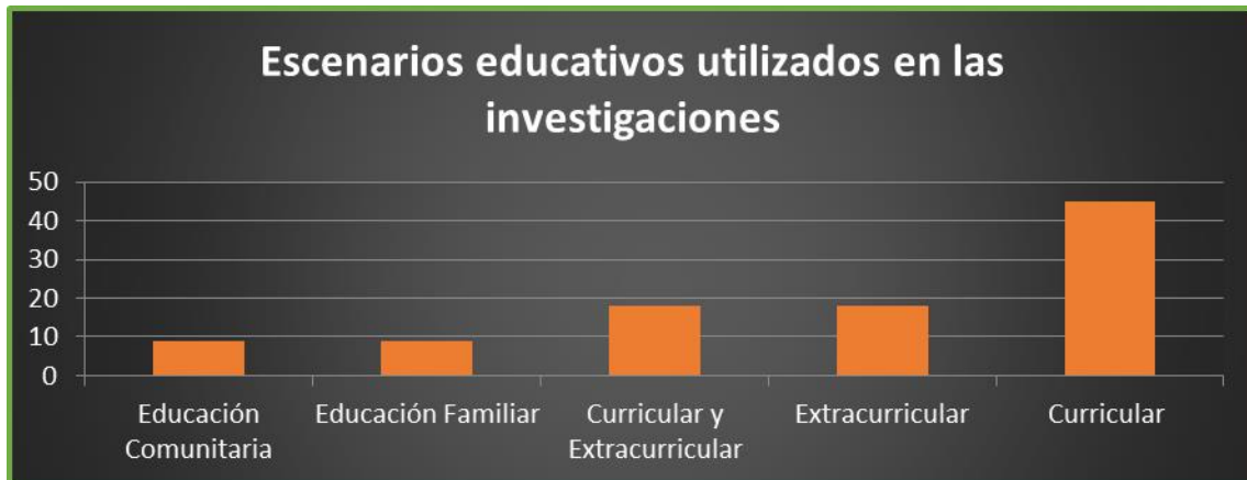
Fig. 3: Distribución de los escenarios educativos educativas .Fuente: Elaboración propia

asignaturas no se observa una intensión marcada a resaltar las potencialidades de otras asignaturas para la manifestación de este proceso. (ver Figura 3)