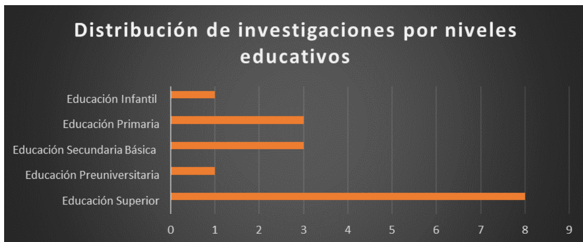
Fig. 2: Distribución de investigaciones por niveles educativos.

Los trabajos que fueron analizados en la presente investigación cubren la casi totalidad de los niveles educativos existentes en el país. Solo no se observan investigaciones dirigidas a la educación de adultos. (ver Figura 2)