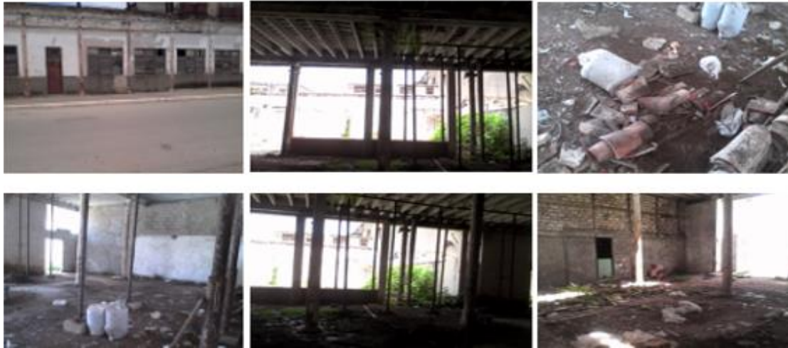
Figura 3. Local en ruinas propuesto para la inversión del Complejo de Servicios Integrales de la Agricultura Urbana: "Entrelazarte".

La ponencia presentada es novedosa porque refleja la forma en que una comunidad, a partir de un proceso de intervención comunitaria que le permitió pasar de comunidad en sí a comunidad para sí; con espacios de tiempo en la cotidianidad para la participación activa, creadora y autónoma en proyectos colectivos, que implican autogestión. Demuestra además el tránsito de una comunidad receptora del turismo, con sujetos que prácticamente no se implicaban en los procesos transformadores del lugar donde residen; a una comunidad receptora del turismo, donde se establecen relaciones sociales entre sujetos patrimonializados, autoridades, y agentes patrimonializadores y turísticos (locales y extraterritoriales), en un espacio de igual condición y beneficios.